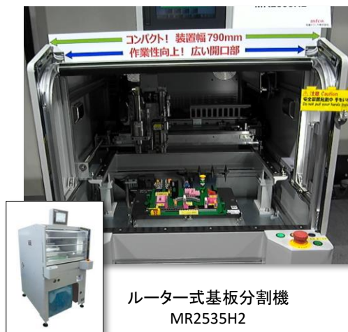
ルーター式基板分割機 MR2535H2