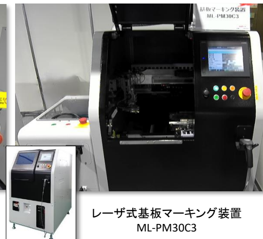
レーザ式基板マーキング装置 ML-PM30C3